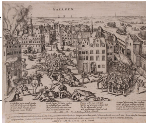
1 – HET BLOEDBAD VAN NAARDEN

Op de voorstelling zien we het bloedbad en gruwelen aangericht door Don Frederik van Toledo (“Alva”) en zijn generaal Romero te Naarden, op 30 nov. 1572.