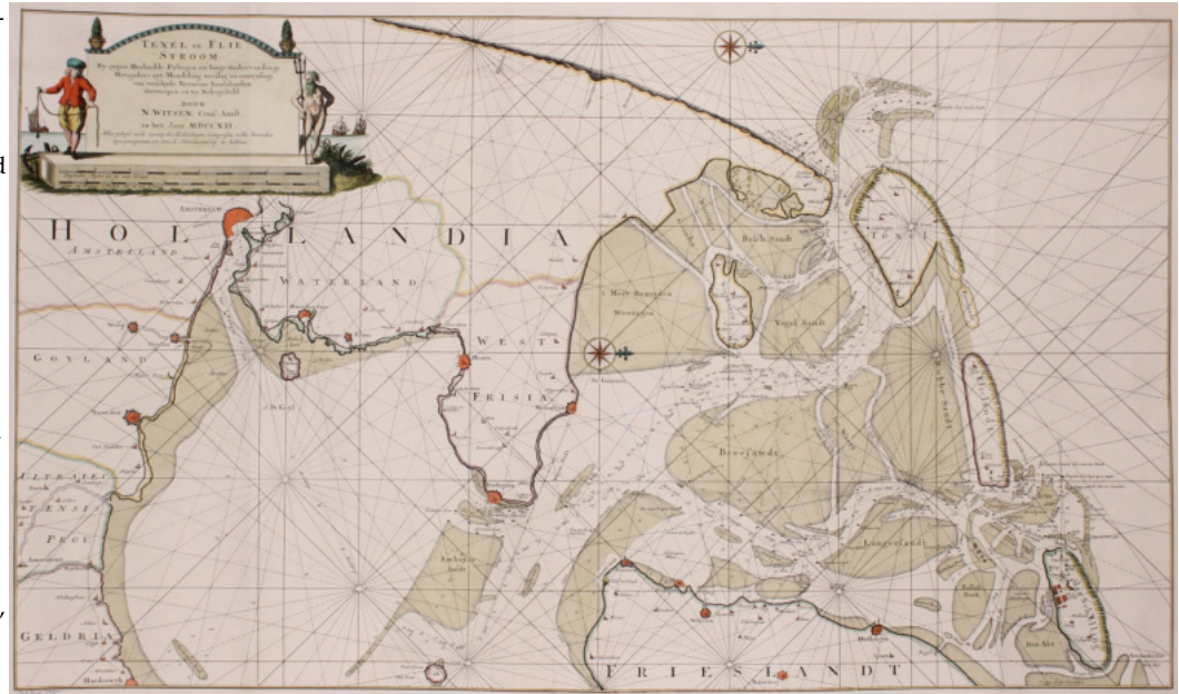
12—ZEEGATEN VAN DE ZUIDERZEE DOOR NICOLAAS WITSEN

Nicolaas Witsen (1641-1717) was burgemeester van Amsterdam en heeft zich persoonlijk bezig gehouden met de hydrografische kartering van de zeegeaten van de Zuiderzee. Sedert 1696, toen hij inspecteur van de commissie van de pilotage werd, nam hij deel aan de opname van de zeegeaten het Vlie en het Marsdiep. Het resultaat is bewaard gebleven in deze grote gedetailleerde kaart.