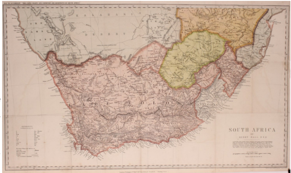
14 – VROEGE KAART VAN ZUID-AFRIKA DOOR HENRY HALL

In 1856 publiceerde Stanford's Geographical Establishment de uitgebreide kaart van Henry Hall van de Kaapkolonie. Deze kaart, samengesteld uit uitsluitend lokale informatie, overtrof niet alleen zijn voorgangers in schaal en volledigheid, maar was ook opmerkelijk nauwkeurig. Onze kaart is een update van de kaart van Hall uit 1856, herzien en gecorrigeerd tot augustus 1874.